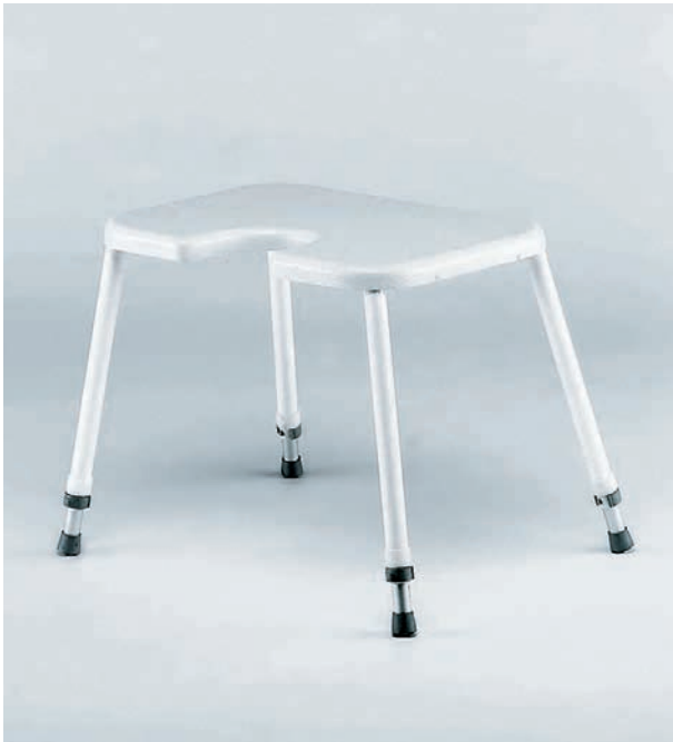
Duschhocker ohne Armlehnen mit Hygieneaussparung