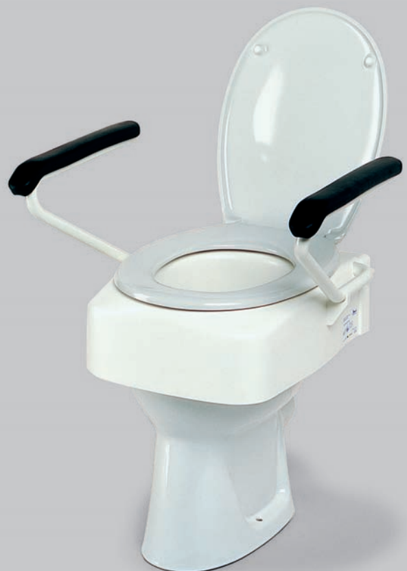
Toilettensitzerhöhung mit Armlehnen

Toilettensitzerhöhungen stehen in unterschiedlichen Höhen (8, 12, 16 cm) zur Verfügung; einfache Ausführungen werden mit Hilfe von Befestigungsklemmen direkt am Beckenrand fixiert. Höherwertige Produkte verfügen beispielsweise über integrierte Armlehnen und werden statt an der Toilettenbrille sicher in den dafür vorgesehenen Halterungen fixiert.