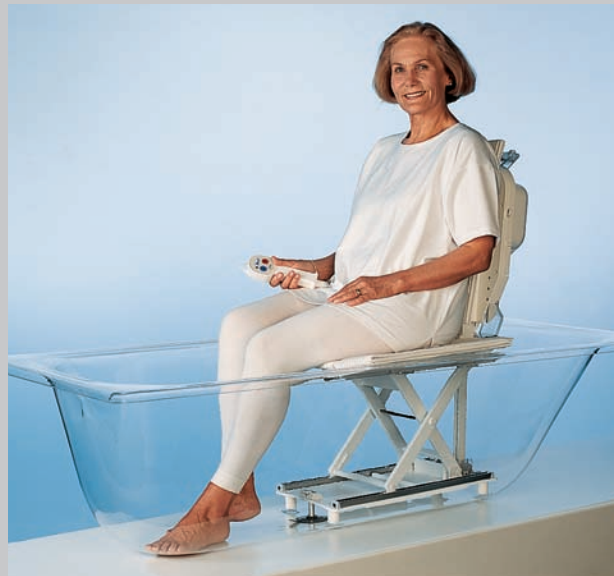
Akkubetriebener Badewannenhilfen mit Drehhilfe

Sitzfläche und Seitenklappen sind mit einem rutschfesten, waschbaren Bezug verkleidet. Je nach Modell kann die Rückenlehne über die leicht bedienbare Steuerung komplett nach hinten abgesenkt werden, so dass ein Vollbad möglich ist. Beim Übersetzen vom Rollstuhl auf den Badewannensitz (und umgekehrt) erleichtern passende Drehhilfen den Transfer.